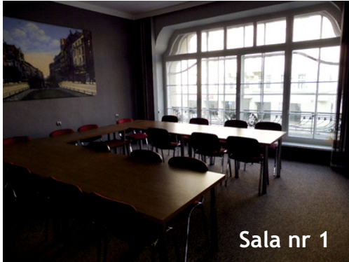
Sala nr 1

Zapraszamy do organizacji konferencji, szkoleń, spotkań firmowych w naszej kamienicy ul.Św.Marcin 69 . Oferujemy wszelkie udogodnienia konferencyjne łącznie z nowoczesnym sprzętem audiowizualnym i bezprzewodowym dostępem do Internetu. Możliwość zorganizowania cateringu.