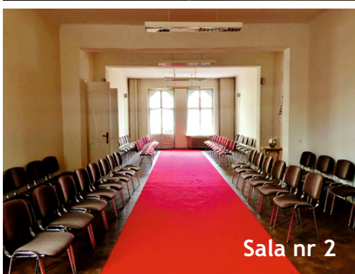
Sala nr 2