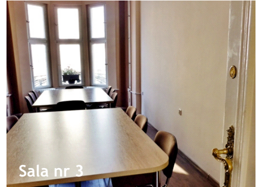
Sala nr 3