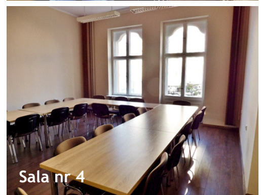
Sala nr 4